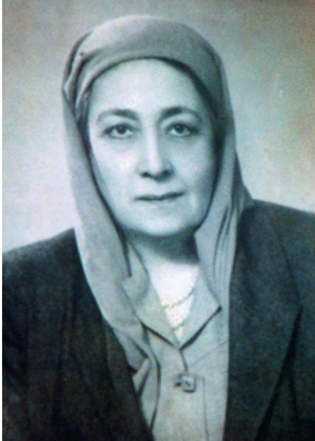
Figure 2. Hudá Sharáwí, dirigeante du mouvement féminin égyptien entre 1919 et 1923